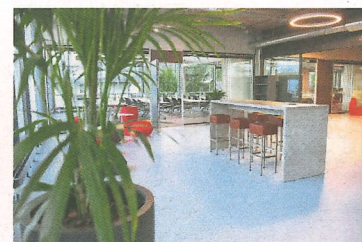
Die Räume für Tagungen bieten moderne Technik eines Büros.