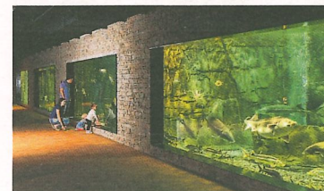
In den Aquarien schwimmen Fische verschiedener Arten.

Fitnesscenter. Eine besondere Attraktion ist das Aquarium im Erdgeschoss mit einer Grösse von immerhin 863 Quadratmetern und einer Gesamtlänge von 42 Metern. Die vier bis zur Raumdecke reichenden Becken mit mehreren Tausend Litern Wasser werden von Fischarten wie Stören, Welsen, Rochen und anderen bewohnt. Darauf kann jeder grössere Zoo neidisch sein. In diesem Raum, dem eine Bar angeschlossen