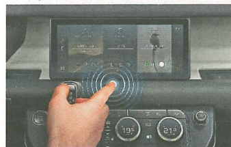
Das neue System von JLR soll bei Fahrbahnebenheiten besser sein.

Die von Jaguar Land Rover und der Universität Cambridge entwickelte Touchscreen-Technologie Predictive Touch nutzt künstliche Intelligenz und Sensoren, um Bedienungen berührungslos auszuführen. Das kontaktlose System verringert nicht nur die Ausbreitung von Bakterien