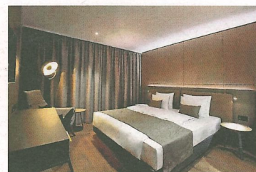
Die Zimmer im «Meilenstein» sind wohnlich gestaltet und modern eingerichtet.

Und wenn man ein neues Fahrzeug sucht oder sich für ein luxuriöses Mietfahrzeug interessiert, ist die Aus-