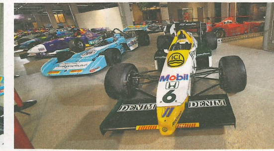
Keke Rosberg gewann mit diesem Williams-Honda FW09 in der F1-Saison 1984 den Grossen Preis der USA in Dallas.