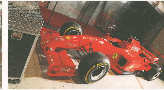
Im Rennsimulator kann man leicht erahnen, worauf ein Fahrer während eines Rennens achten muss.