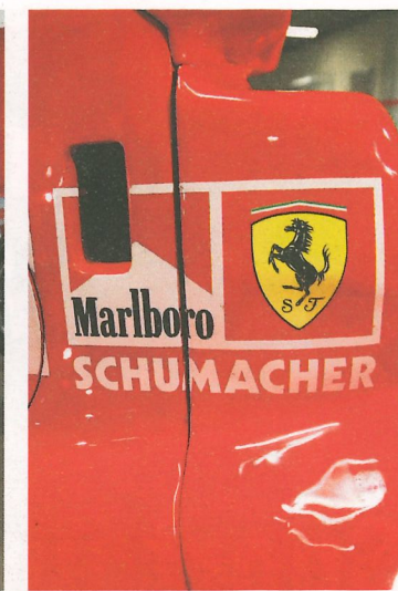
Der Name Michael Schumacher steht im Mittelpunkt der Show.

wahl riesig. Für Hochzeiten und andere besondere Events steht sogar ein individuell aufgemachter Rolls-Royce zur Verfügung. Auf Wunsch mit Chauffeur.