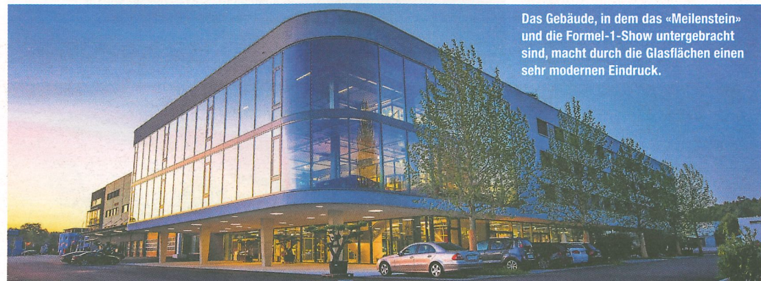
Das Gebäude, in dem das «Meilenstein» und die Formel-1-Show untergebracht sind, macht durch die Glasflächen einen sehr modernen Eindruck.