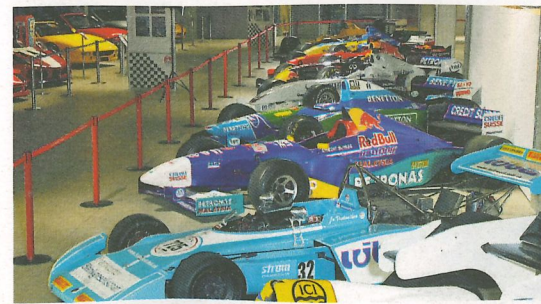
Rad an Rad stehen Boliden von unterschiedlichen Herstellern, die in der Formel 1 und Formel 2 Geschichte geschrieben haben.