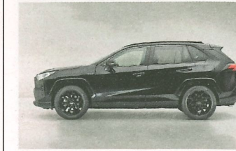
Die rundum schwarze Lackierung gibt dem RAV4 einen markanten Auftritt.

Der optisch getunte RAV4 Hybrid Black Edition kommt im unifarbigen Look. Die tiefglänzende Lackierung Attitude Black lässt Kanten und Kurven der Karosserie markanter hervortreten. Frontgrill, Stossfänger, Spiegelgehäuse, Unterfahrschutz, Heckleiste, Spoiler und selbst die Park-