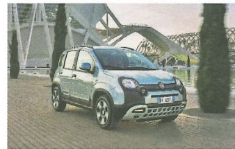
Die Fiat Pandas laufen mit Benzin, Autogas (LPG) oder Erdgas (CNG).

Vom Fiat Panda Hybrid ist neben der Offroad-Version jetzt auch eine Launch Edition erhältlich. Die neue Variante erweitert das Angebot der elektrifizierten Modelle der Marke. Der Panda Hybrid Urban kombiniert einen Dreizylinder-Benziner mit 70 PS mit einem riemen-